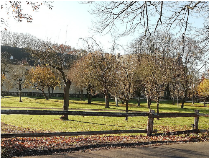
Obstwiese "Burg Adendorf Süd" in Wachtberg (2019)