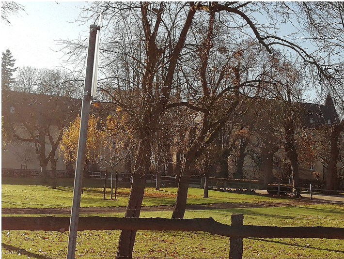
Obstwiese "Burg Adendorf Nord" in Wachtberg (2019)