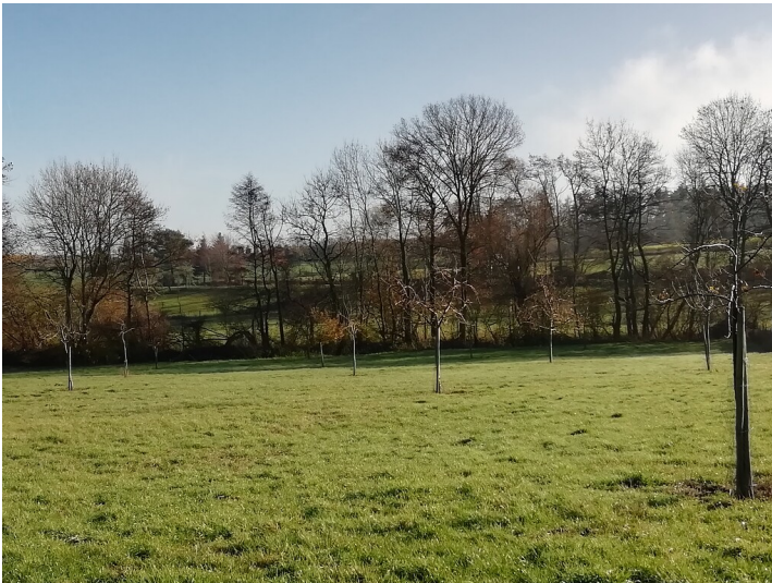
Obstwiese "Haus Jägersruh" in Meckenheim (2019)