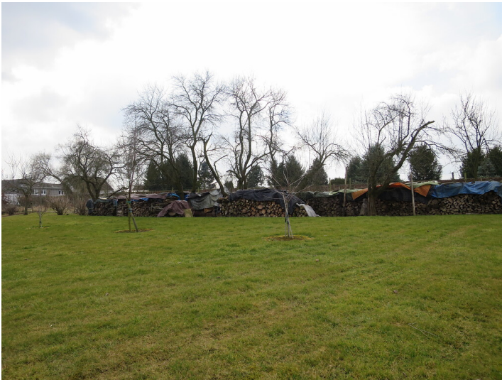
Obstwiese "Ober dem Lindenhof" in Meckenheim (2018)