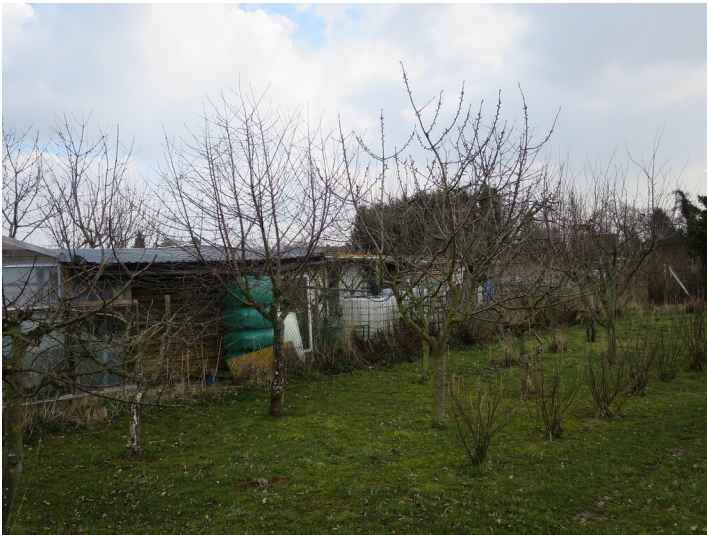
Obstwiese "Hinter der Klause" in Meckenheim (2018)