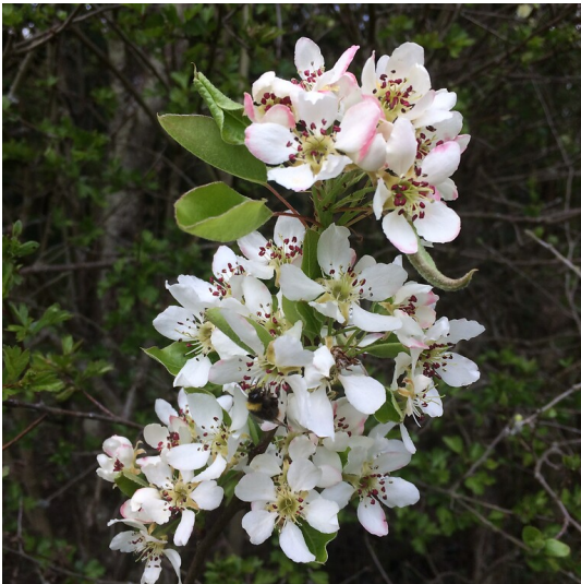
Birnbaumblüten mit einer die Blüten besuchenden Hummel (2021)