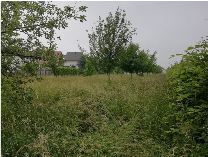
Obstwiese "An der Glasfachscheule" in Rheinbach (2018)