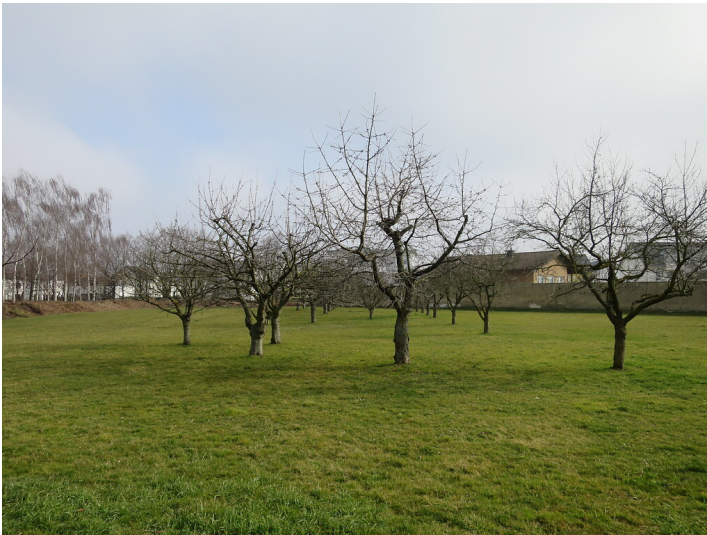
Obstwiese "Kalkofenstraße" in Meckenheim (2018)