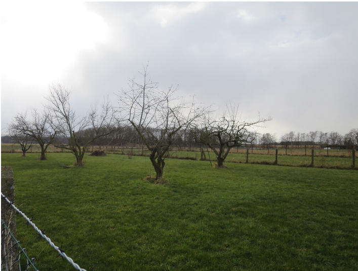
Obstwiese "Greesgraben" in Rheinbach (2018)