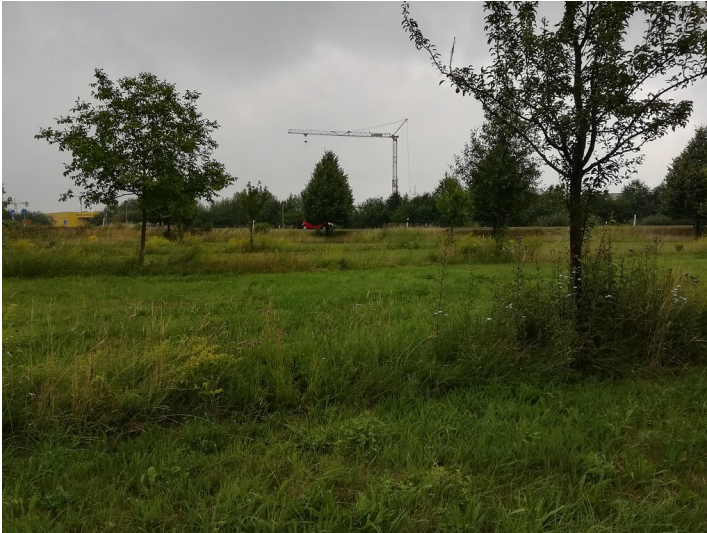
Obstwiese "Rosenacker Süd" in Meckenheim (2018)