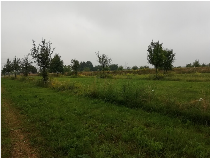
Obstwiese "Rosenacker Nord" in Meckenheim (2018)