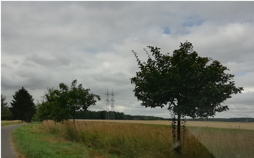
Obstwiese "Am kleinen Saueracker" in Alfter (2018)