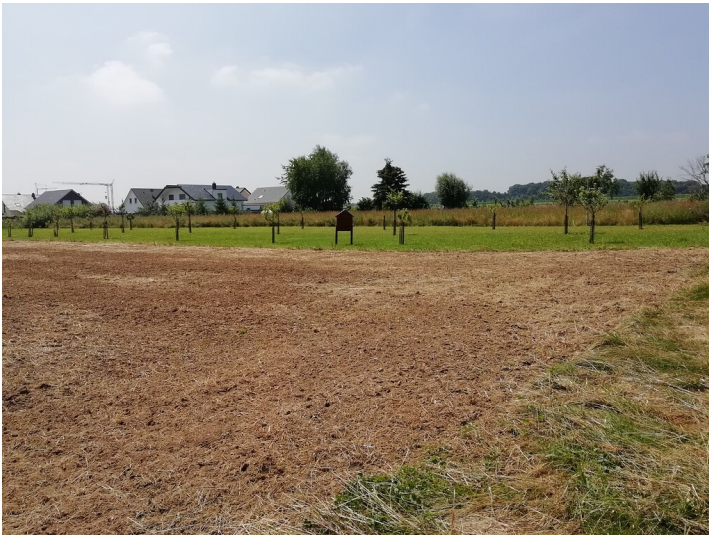
Obstwiese "Im Kammerfeld" in Swisttal (2018)