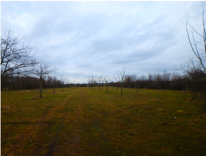
Obstwiese "Hüllenpfad" in Bornheim (2018)