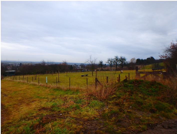
Obstwiese "Dornerbroch" in Bornheim (2018)