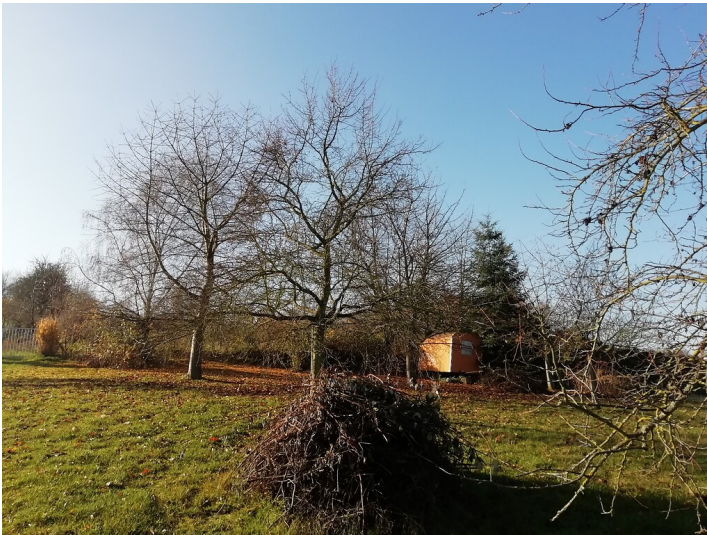
Obstwiese "Keimerstraße" in Bornheim (2019)