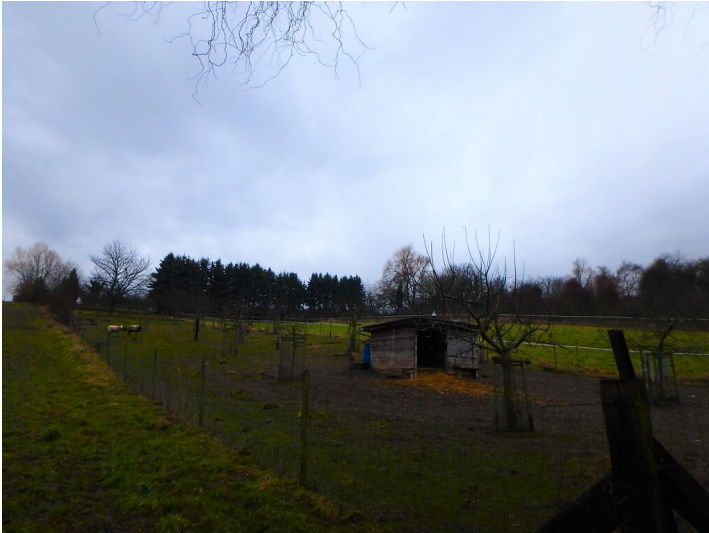
Obstwiese "Fendel" in Bornheim (2018)