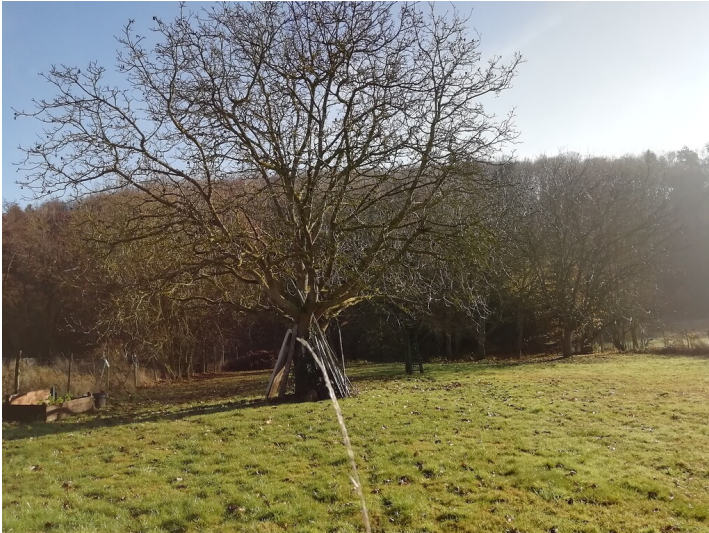
Obstwiese "Ganswiesen" in Meckenheim (2019)