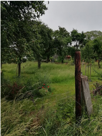
Obstwiese "Auf dem Pützfeld" in Rheinbach (2018)