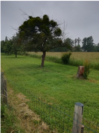
Obstwiese "Mörikeweg" in Rheinbach (2018)