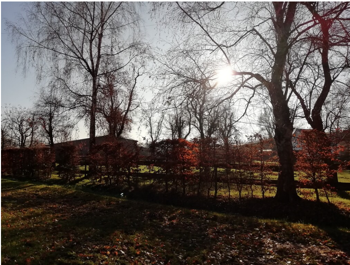
Obstwiese "Lüsbacher Weg" in Alfter (2019)