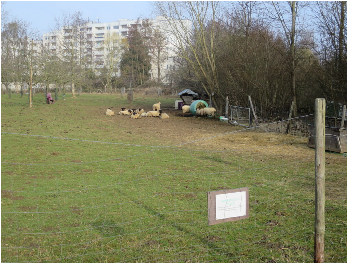
Obstwiese "Mühlgraben" in Meckenheim (2018)