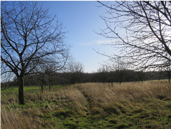
Obstwiese "Am Ringelpfad" in Bornheim (2018)