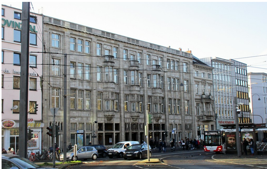
Das Bing-Haus am Kölner Neumarkt Nr. 15-21 (2019), einstiges Geschäftshaus und heute Sitz des Gesundheitsamts Köln.