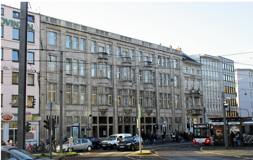
Das Bing-Haus am Kölner Neumarkt Nr. 15-21 (2019), einstiges Geschäftshaus und heute Sitz des Gesundheitsamts Köln.