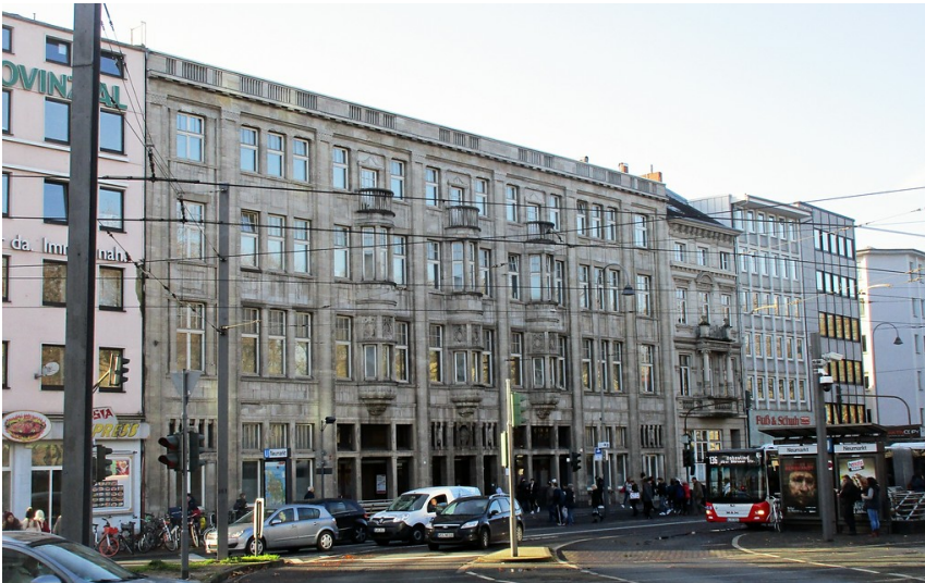
Das Bing-Haus am Kölner Neumarkt Nr. 15-21 (2019), einstiges Geschäftshaus und heute Sitz des Gesundheitsamts Köln.