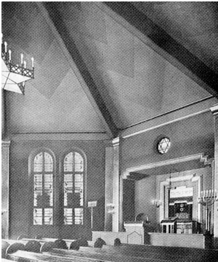
Historische Aufnahme von 1927 mit Blick auf den Toraschrein, die Bima (Kanzel) und das Ner Tamid (Ewiges Licht) im Inneren der Ehrenfelder Synagoge in der Körnerstraße.