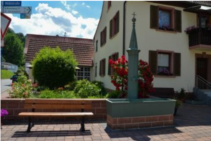
Trinkwasserbrunnen in der Mühlstraße/Ecke Hauptstraße in Bobenthal (2019)