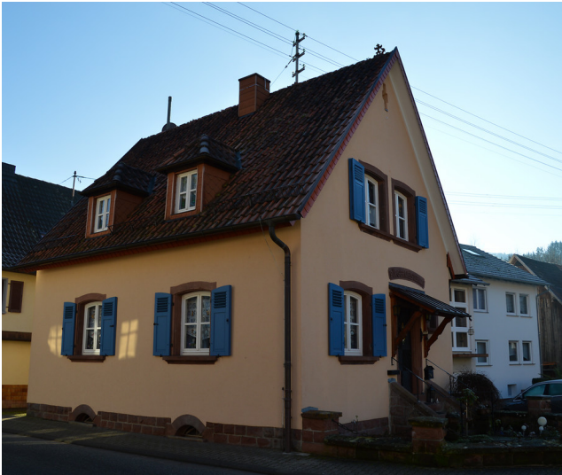
Altes Bürgermeisteramt in Bobenthal (2019)