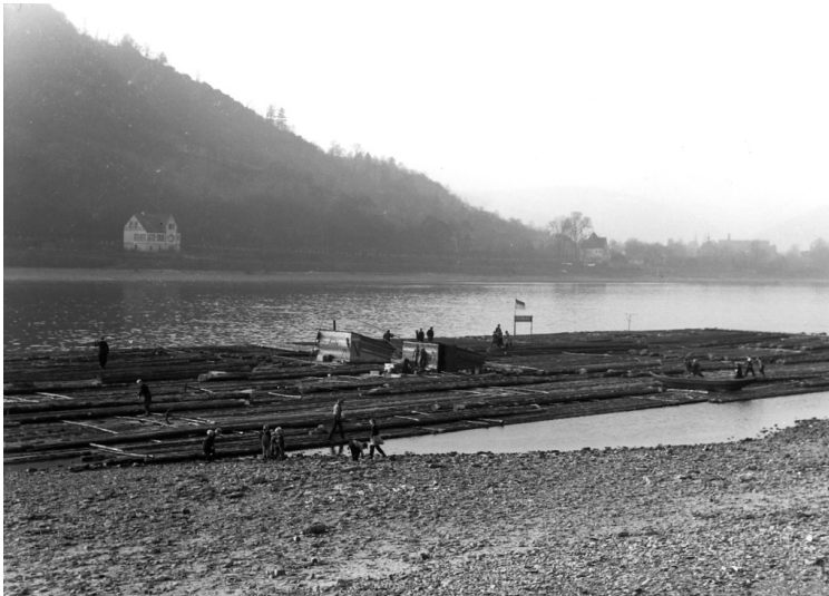
Das letzte Floß, das in Kamp-Bornhofen lag (1968)