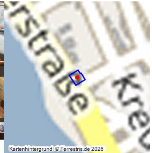
Das Flößer- und Schiffermuseum Kamp-Bornhofen - ein virtueller Rundgang

Das Rathaus in der Rheinuferstraße 34 in Kamp-Bornhofen wurde unter Bürgermeister Johann Josef Kimmel im Jahre 1853 erbaut. Das Gebäude war zunächst einstöckig, wurde aber bereits im Jahre 1854, also gerade mal ein Jahr später, um ein Stockwerk erhöht. Für das Rathaus wurden Bruchsteine aus dem „Neuen Steinbruch“ in Kamp gewonnen. Im Jahre 1908 wurde das Rathaus erneut aufgestockt. Zu diesem Objekt gibt es einen interaktiven 360-Grad-Rundgang . Das Rathaus in Kamp-Bornhofen ist Station des Themenweges zur Flößerei mit seinen neun Stationen.