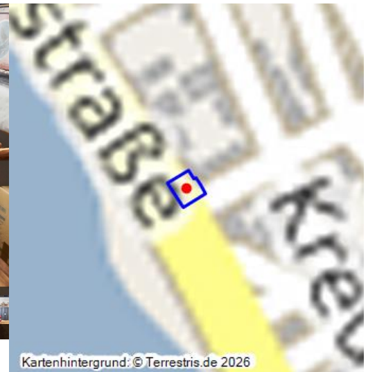
Das Flößer- und Schiffermuseum Kamp-Bornhofen - ein virtueller Rundgang

Das Rathaus in der Rheinuferstraße 34 in Kamp-Bornhofen wurde unter Bürgermeister Johann Josef Kimmel im Jahre 1853 erbaut. Das Gebäude war zunächst einstöckig, wurde aber bereits im Jahre 1854, also gerade mal ein Jahr später, um ein Stockwerk erhöht. Für das Rathaus wurden Bruchsteine aus dem „Neuen Steinbruch“ in Kamp gewonnen. Im Jahre 1908 wurde das Rathaus erneut aufgestockt. Zu diesem Objekt gibt es einen interaktiven 360-Grad-Rundgang . Das Rathaus in Kamp-Bornhofen ist Station des Themenweges zur Flößerei mit seinen neun Stationen.