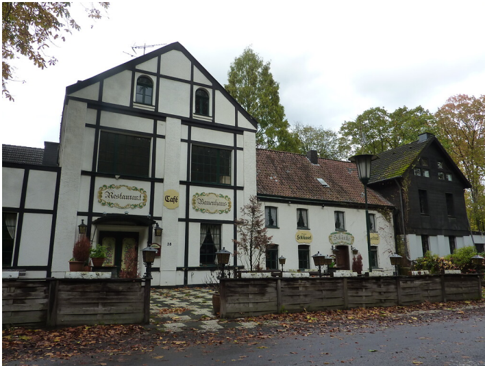
Gasthof Bauenhaus (2019)