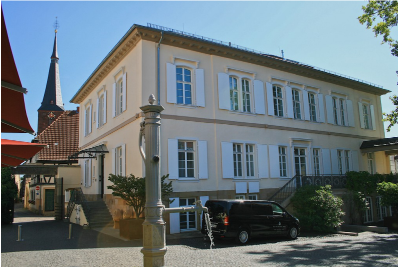
Ketschauer Hof in Deidesheim (2019)