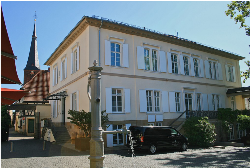
Ketschauer Hof in Deidesheim (2019)