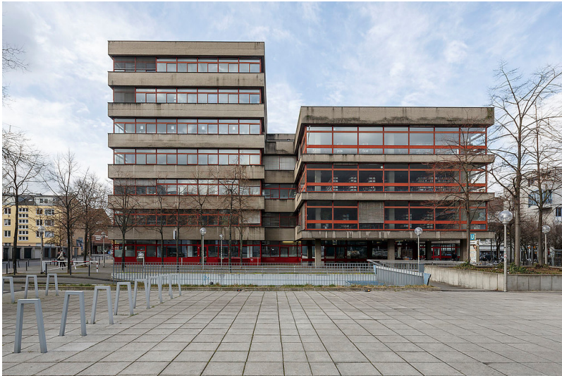
Blick auf die 1979 errichtete Zentrale der Kölner Stadtbibliothek im Kulturquartier am Josef-Haubrich-Hof (2015).