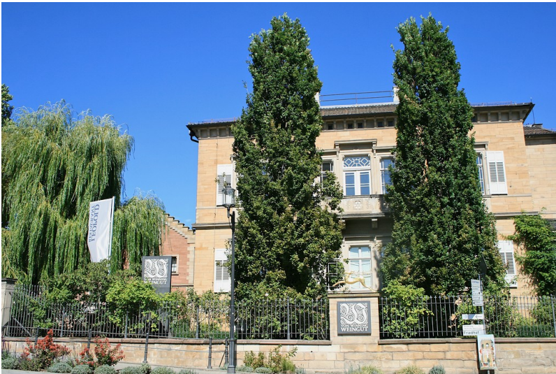
Weingut von Winning in Deidesheim (2019)