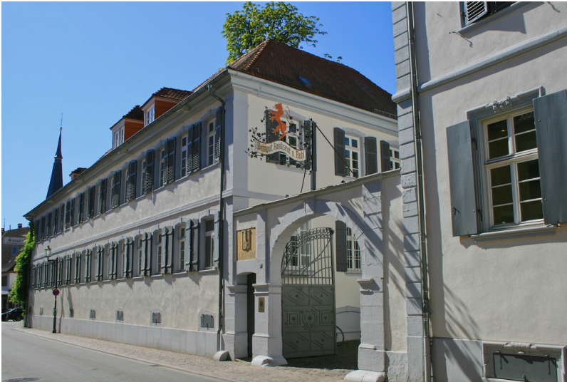
Weingut Reichsrat von Buhl in Deidesheim (2019)