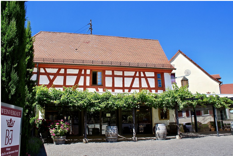
Weingut Geheimer Rat Dr. Bassermann-Jordan in Deidesheim (2019)