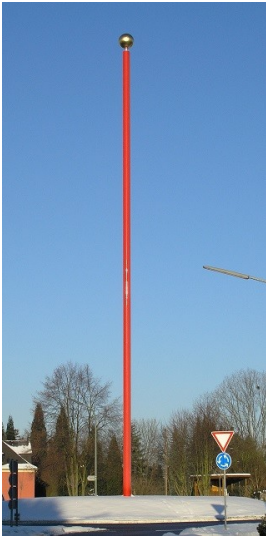
Skulptur Zwischen Himmel und Erde in Höhr-Grenzhausen (2005)