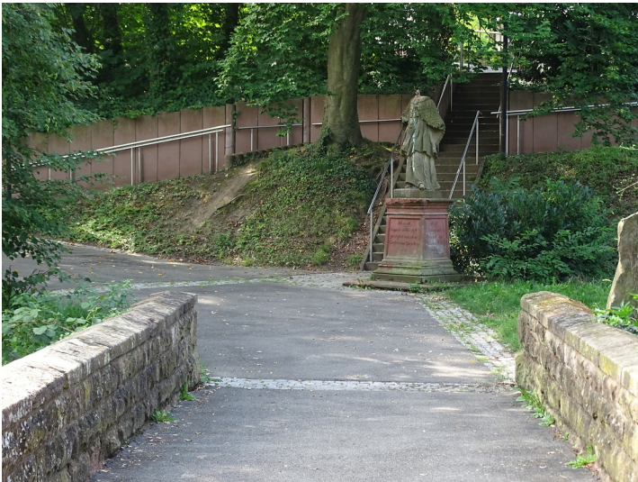
Standbild Johannes Nepomuk in Hördt (2019)