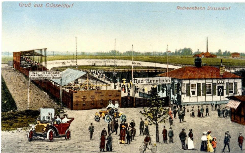
Historische Postkarte "Grüß aus Düsseldorf" (um 1907-1914) mit der Radrennbahn Düsseldorf im 1909 eingemeindeten Stadtteil Lörick.