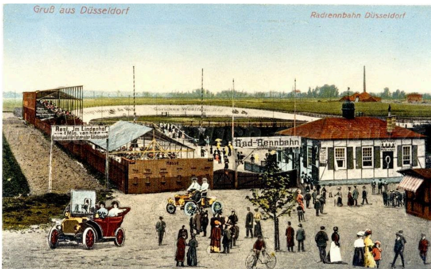
Historische Postkarte "Gruß aus Düsseldorf" (um 1907-1914) mit der Radrennbahn Düsseldorf im 1909 eingemeindeten Stadtteil Lörick.