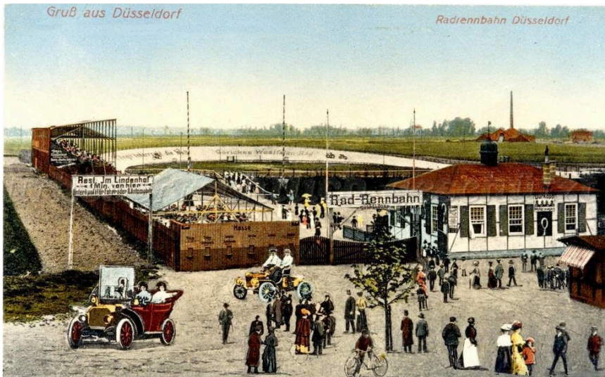
Historische Postkarte "Gruß aus Düsseldorf" (um 1907-1914) mit der Radrennbahn Düsseldorf im 1909 eingemeindeten Stadtteil Lörick.