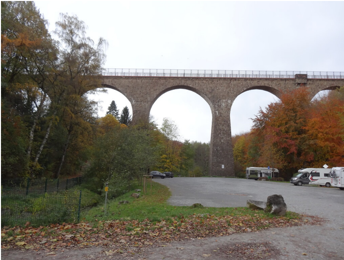
Das Eulenbachviadukt alias Saubrücke in Velbert (2019)