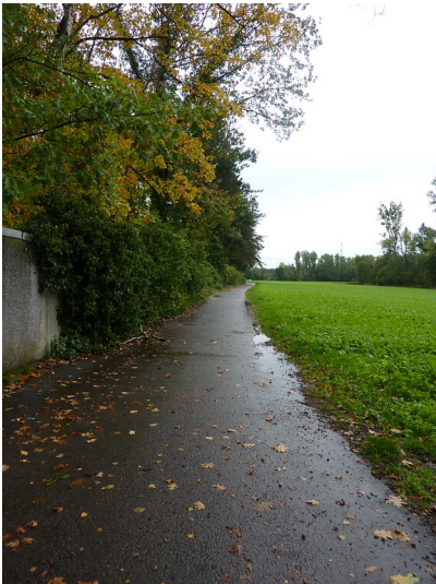
Die Kalkstraße im Westen von Lintorf (2019)