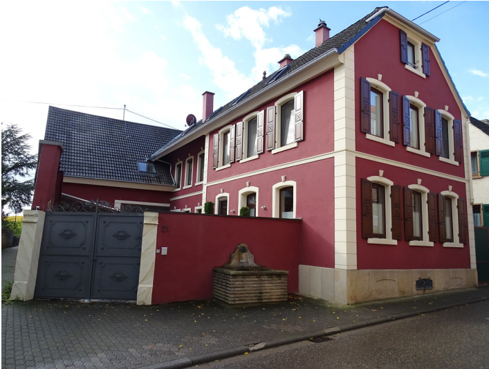
Wohnhaus Hauptstraße 21 in Alsterweiler (2019)