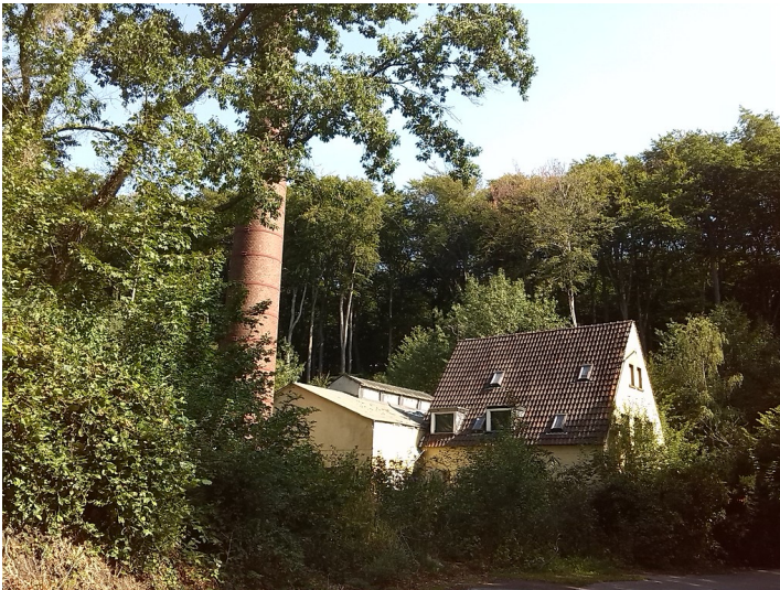
Kesselhaus der leerstehenden Klinik Aprath (2019)