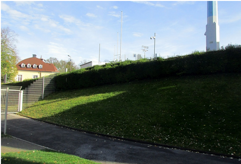
Blick von außen auf den nordwestlichen Außenwall am Stadion am Zoo in Wuppertal-Elberfeld (2019), der Wall ist das letzte Relikt der früheren Radrennbahn.