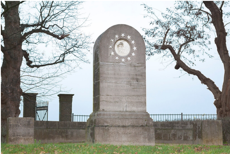
Frontansicht des Johanna-Sebus-Denkmals in Kleve-Wardhausen (2015)