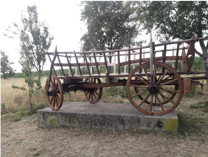
Fuhrwerk Ziegler aus Alsterweiler (2019)