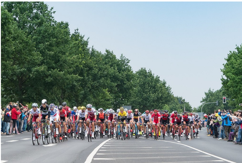
Das Hauptfeld der Tour de France am 2. Juli 2017 auf der Landstraße L 381 bei Kaarst-Büttgen.