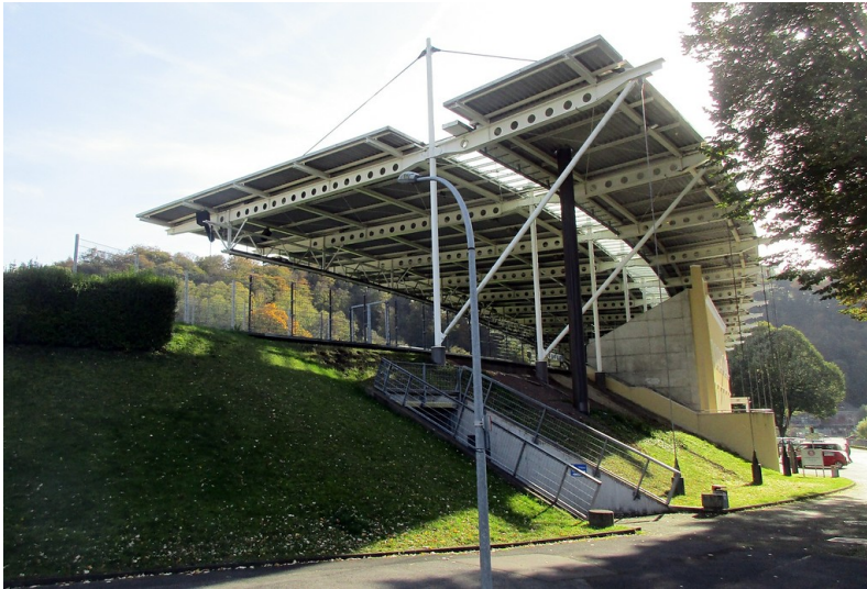
Die westliche Haupttribüne mit der denkmalgeschützten Schildwand am Stadion am Zoo in Wuppertal-Elberfeld (2019).