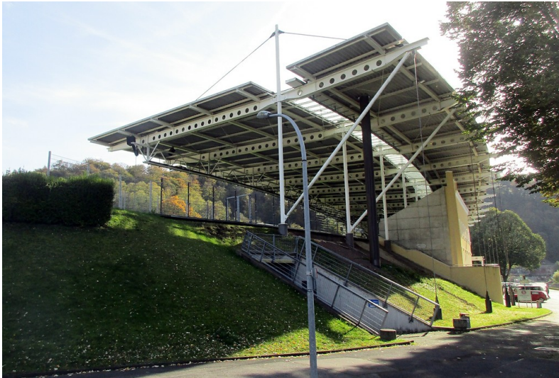
Die westliche Haupttribüne mit der denkmalgeschützten Schildwand am Stadion am Zoo in Wuppertal-Elberfeld (2019).